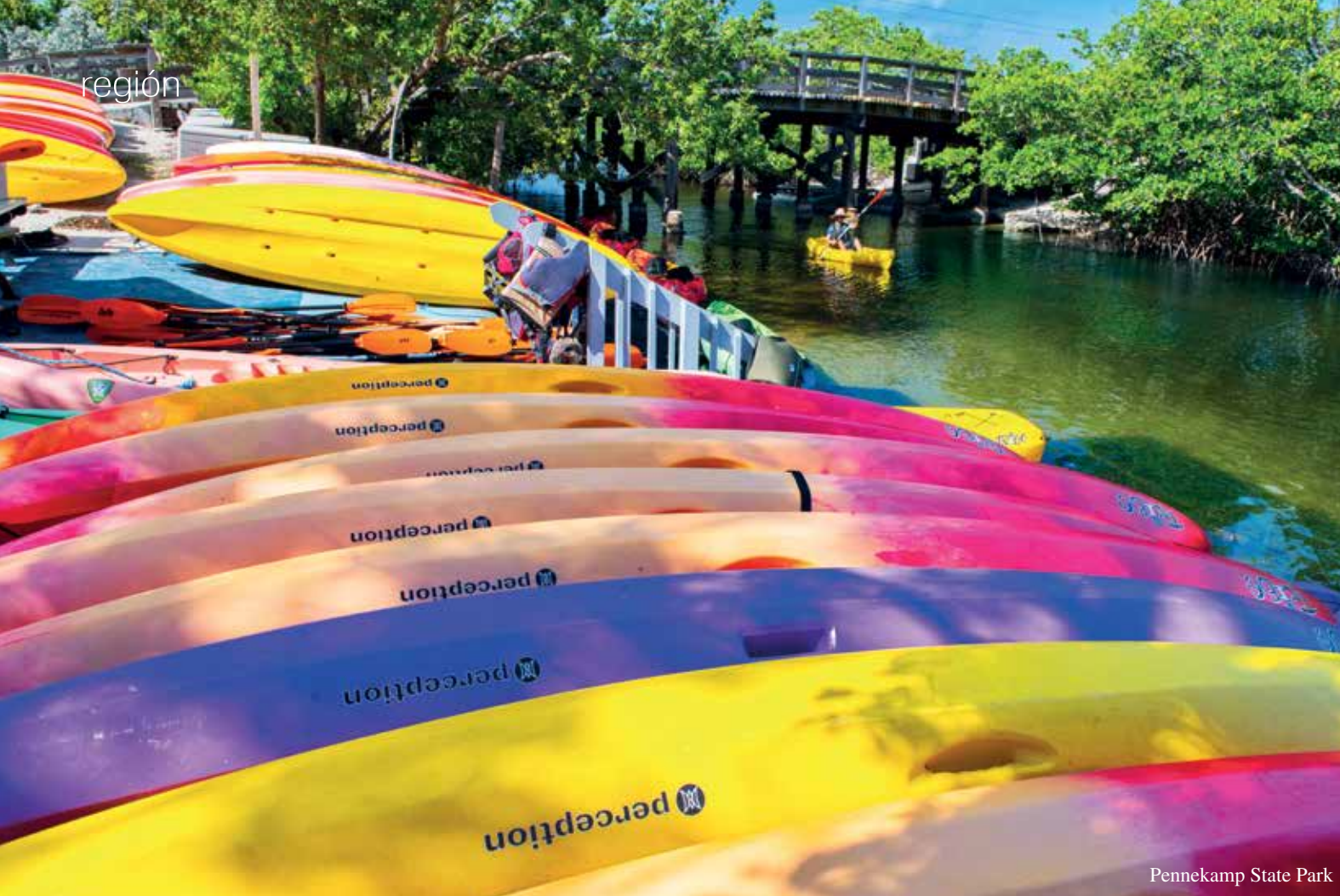
Pennekamp State Park