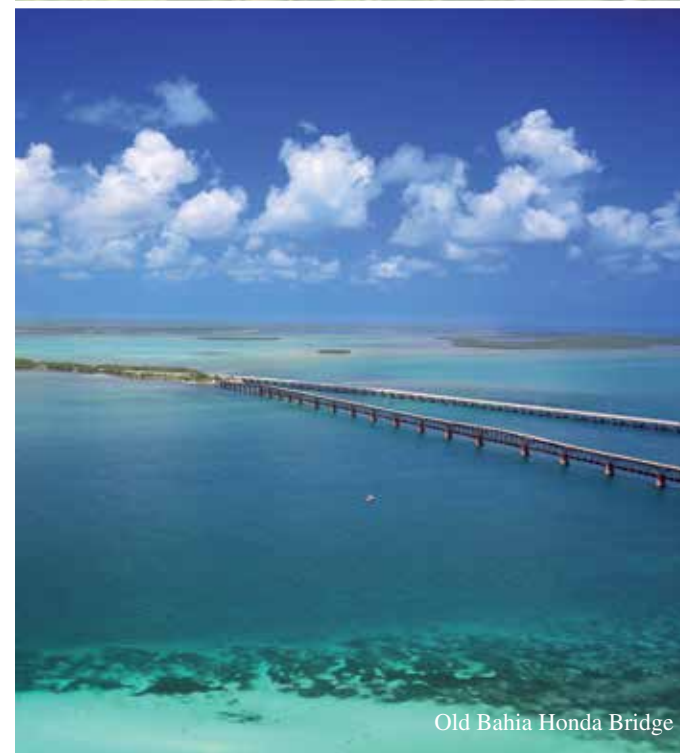
Old Bahia Honda Bridge

Key Deer Refuge solo quedaban 27 de estos ciervos, pero entretanto su población ha crecido hasta rondar los 800. Lo mejor es observar a los ciervos alrededor del amanecer o el atardecer. El punto de partida es el centro de visitantes, y hay varias plataformas de observación, así como rutas de senderismo y ciclismo.