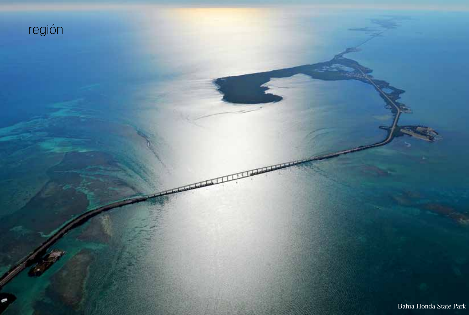
Bahia Honda State Park