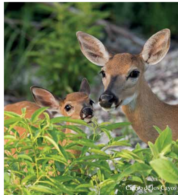
Ciervo de los Cayos